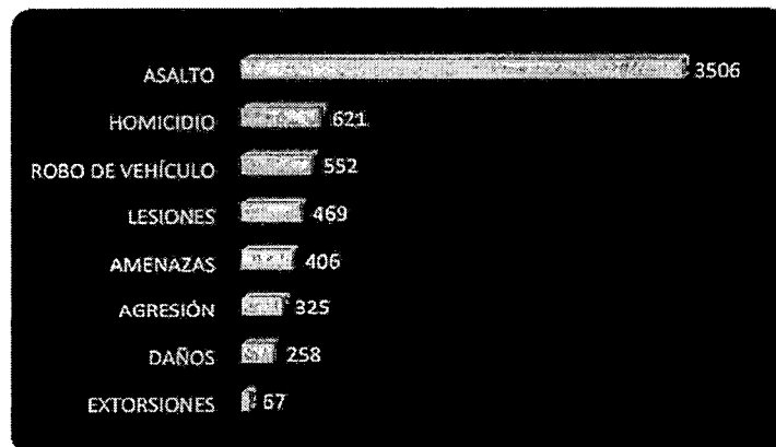
Gráfico N°2 Cantidad de denuncias por los delitos seleccionados, con utilización de arma de fuego A nivel nacional, enero – noviembre* de 2023, POR DELITO

Nota: Del mes de noviembre se muestra hasta el día 23.