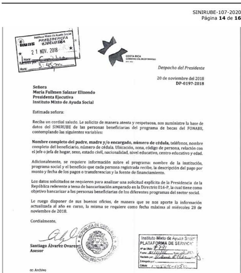
Imagen 3 Oficio DP-0197-2018