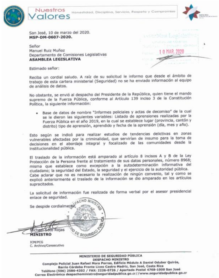
Imagen 2 Oficio MSP-DM-06-07-2020

“Base de datos de nombre “Informes policiales y actas de decomiso” de la cual se le dieron las siguientes variables: Listado de aprehensiones realizadas por la Fuerza Pública en el año 2019, en la cual se establece lugar (provincia, cantón y distrito) tipo de aprehensión, aprehendido y fecha de la aprehensión (día, mes y año)”